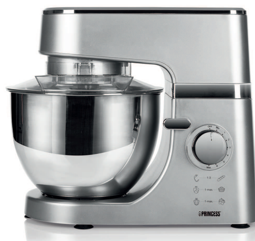
Kitchen machine 01.220122.01.001

PARTS DESCRIPTION / ONDERDELENBESCHRIJVING / DESCRIPTION DES PIÈCES / TEILEBESCHREIBUNG / DESCRIPCIÓN DE LAS PIEZAS / DESCRIÇÃO DOS COMPONENTES / DESCRIZIONE DELLE PARTI / BESKRIVNING AV DELAR / OPIS CZĘŚCI / POPIS SOUČÁSTÍ / POPIS SUČASTI