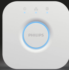
Philips Hue Bridge